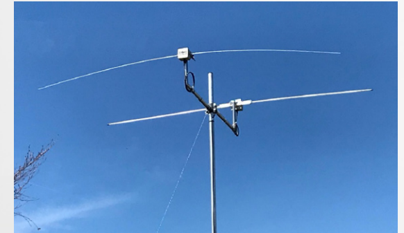
Testaufbau Stampfl AD Datong AD 370

Es werden zwei Drosseln in Serie geschaltet. Die hohe Induktivität ist nötig, um auch für sehr tiefe Frequenzen noch einen hohen Blindwiderstand zu bieten.